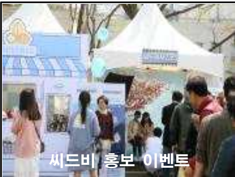
씨드비 홍보 이벤트