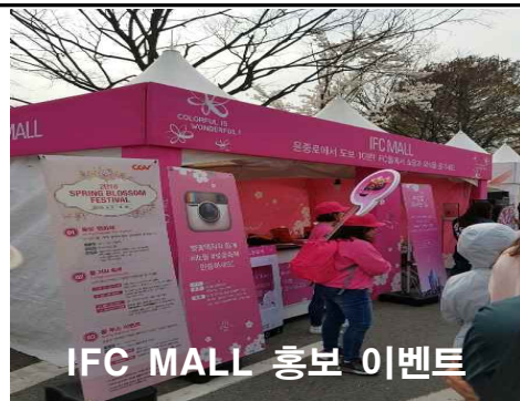
IFC MALL 홍보 이벤트