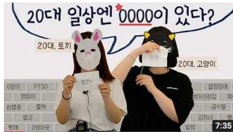
<20대 일상엔 0000이 있다!> - 우림