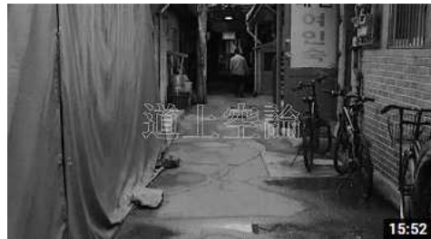
<도상공론> - 마치파이브