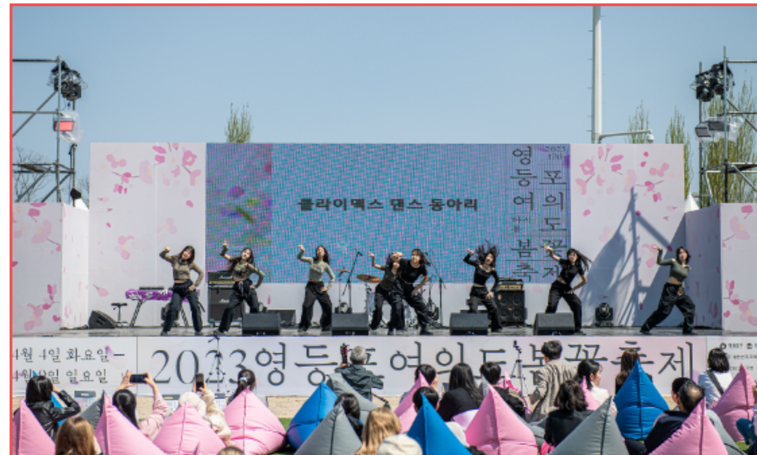
* 예시사진으로 협찬 범위에 따라 브랜드 표기 방식 등이 달라질 수 있습니다.